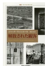
法政大学出版局/2013年