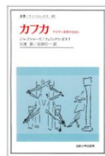
法政大学出版局/1978年