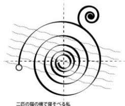
二匹の猫の横で寝る私

この特集では、IAMAS の教員に、自著・人生を変えた本・お薦めの本などを紹介してもらいます。