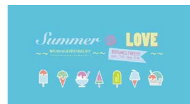
OPEN HOUSE 2017