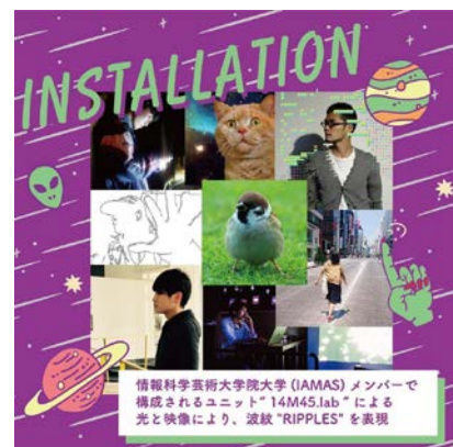
RIPPLES インスタレーション

Interim Report 関連の活動として、Space shower TVとJ-WAVE主催によりStudio Coastで実施された1990年代生まれのアーティストによる音楽イベントRIPPLESに学生チームによるインスタレーション作品を展示した。