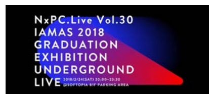
NxPC.Live vol.30 IAMAS2018